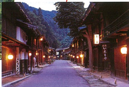
妻籠宿：全国で初めて古い町並みを保存した宿場町。国の重要伝統的建造物群保存地区の第一号。夕暮れ時などは江戸時代にタイムスリップしたような趣がある。