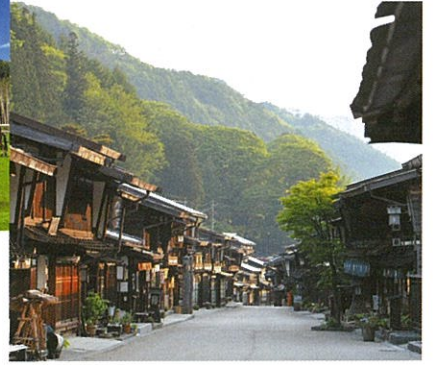
奈良井宿：難所・鳥居峠のふもとにあり江戸時代には「奈良井千軒」と言われるまでに栄えた宿場。「中村邸」「上問屋史料館」など重要文化財も多く残っている。