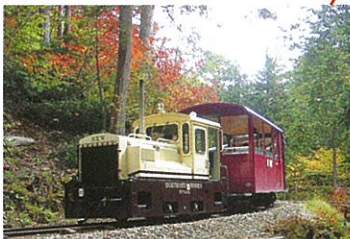
赤沢自然休養林の森林鉄道 森林浴発祥の地・赤沢自然休養林。木曽ヒノキなど樹齢300年を超える樹木の中を森林鉄道が走っている。