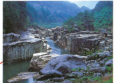
寝覚の床：木曽路を代表する名勝の一つ。木曽川の奇岩とエメラルドグリーンの水色が殊に美しい。浦島太郎伝説も残り、岩の上に祠・浦島堂がまつられている。