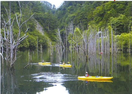
自然湖：長野県西部地震の際、土石流で川がせき止められてできた湖。幻想的な空間のカヌー体験が魅力。