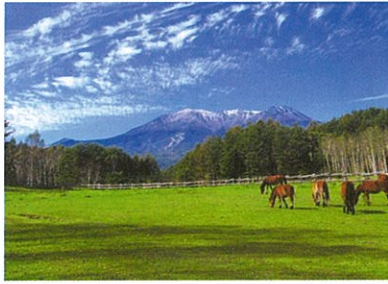
木曽馬の里：高原の放牧場では約30頭余りの木曽馬たちがのんびり草を食んでいて、乗馬体験を楽しむこともできる。

木曽は豊かな自然と水に恵まれた歴史の宝庫です。音楽祭会場になっている木曽駒高原から少し足を伸ばせば、木曽馬に乗ったり、ロープウェイで雄大な景色を眺めたり、古い街並を散策したりと楽しみがいっぱいです。また、そばや五平餅を味わうのも楽しみの一つです。演奏会の始まるまでの時間。魅力あふれる木曽の良さを堪能してみてください。